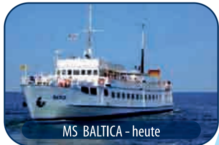
MS BALTICA – heute

1999 wurde sie nach Warnemünde verlegt. Touristen aus der ganzen Welt nutzen seit dem das Angebot und lassen sich vor der schönen Mecklenburger Küste von Seebrücke zu Seebrücke fahren. Bis heute fährt die MS „BALTICA“ mit Ihren ersten beiden zweimal 400 PS starken MAK-Dieselmotoren.