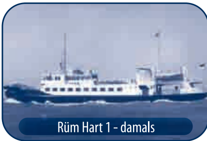
Rüm Hart 1 – damals

Als MS „BALTICA“ war sie künftig in der Lübecker Bucht zu sehen. Ab 1983 fuhr sie dann auf der Flensburger Förde zwischen Kappeln und Sönderborg.